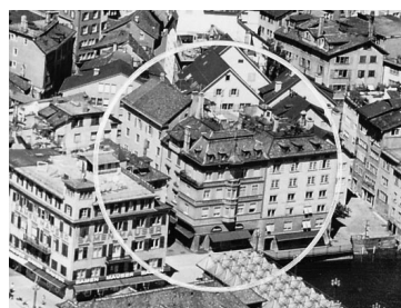
Häuser Nr. 2, 4, 6 und 8, Schipfe