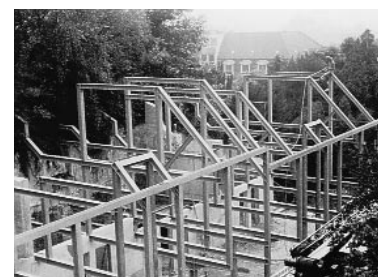
Wohnhäuser Schanzengasse Nr. 12 Stahlkonstruktion