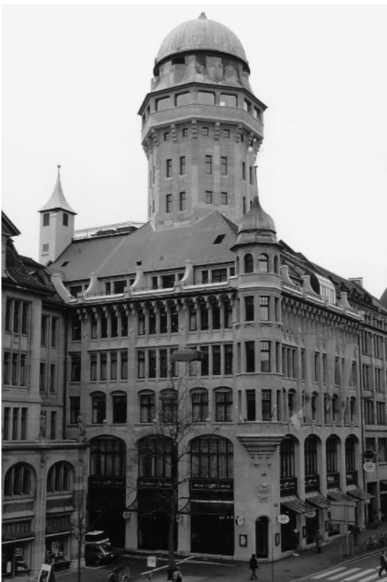
Löwenbräuhaus/Sternwarte Urania, Zürich