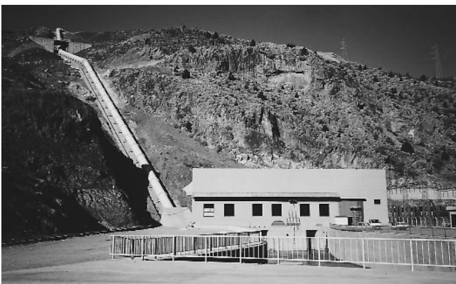
Zentrale des Wasserkraftwerkes Çamlıca I, Türkei