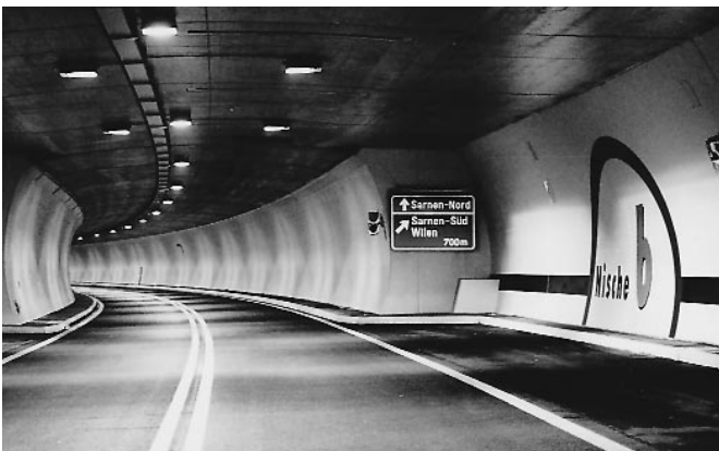
Umfahrungstunnel Sachseln (A8)

Hydraulische, mechanische und elektrotechnische Ausrüstung der nebenstehend aufgeführten Kraftwerke Elektromechanische Ausrüstungen der Tunnels Lopper, Sachseln, Develier (A16) u. a. Übergeordnetes Leitsystem der Nord- und Osttangente Baselstadt Übergeordnetes Leitsystem der Transjurane A16 Kommunikations-Netzwerk in ATM-Technik der Autobahnen A1 im Kanton Freiburg und der A16 im Kanton Jura