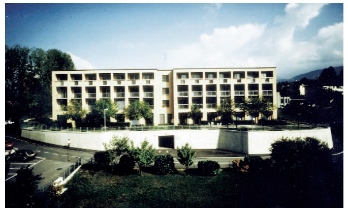
Casa anziani Gemmo, Lugano