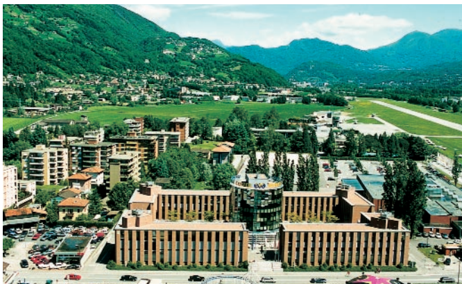
World Trade Center Lugano-Airport