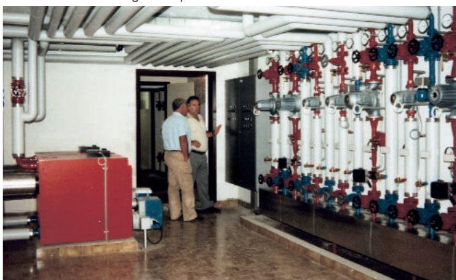
Casa dei bambini Gemmo, Lugano