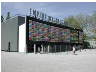
Expo .02 à Bienne Pavillon Swisscom "Empire of Silence"