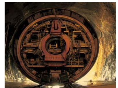
N16 - Tunnel du Mont-Russelin