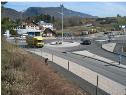
N16 - Jonction Moutier Sud, giratoire VIM