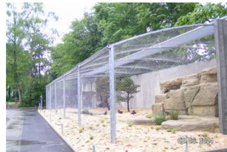
Neubau Waldrappgehege, Tierpark Dählhölzli