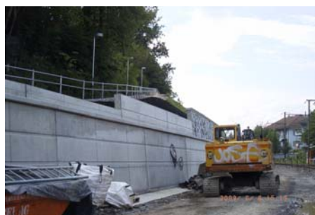
Stützmauer BLS Doppelspur Bern Weissenbühl