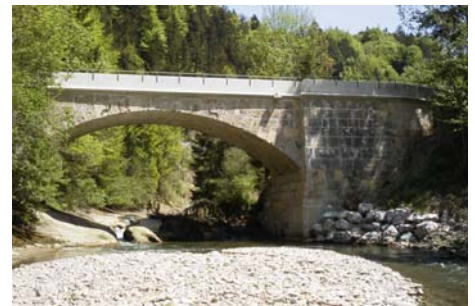
Sanierung Alte Schwarzwasserbrücke