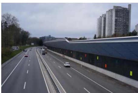
Lärmschutzwand A6 Wittigkofen