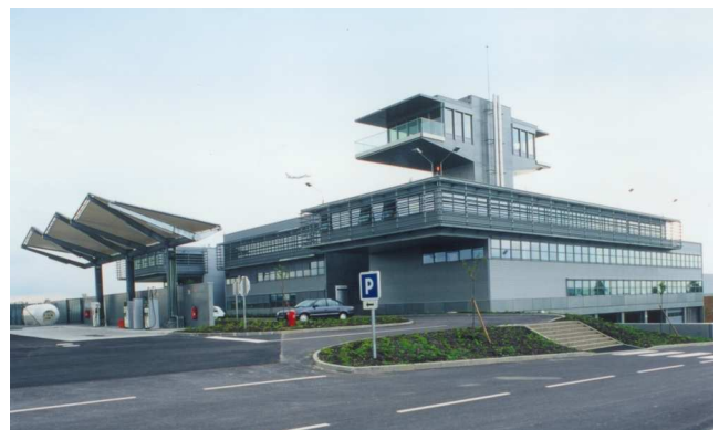
EuroAirport Basel-Mulhouse-Freiburg, Hauptgebäude Werkhof mit Meteoturm