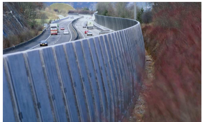
A2, Lärmschutz Zunzgen