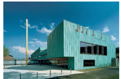
metas, Wabern und Therme, Vals