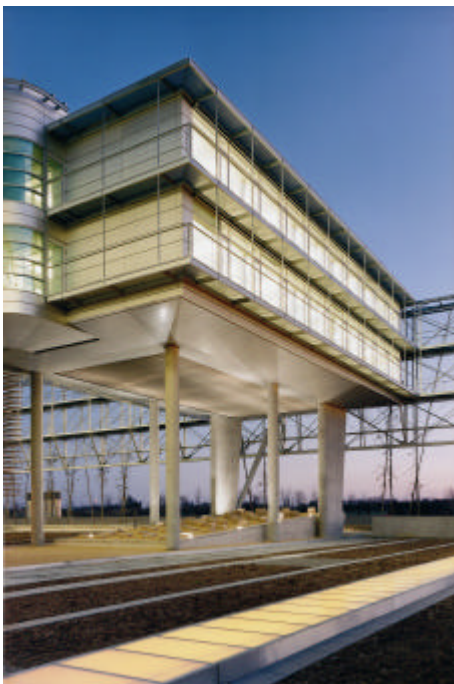
Swiss Re Germany, Unterführung