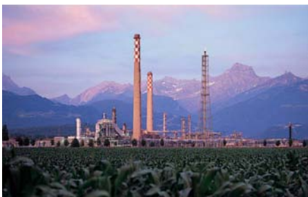
Raffineries du Rhône à Collombey