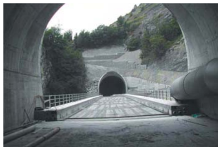
CFF, Double voie Salgesch-Leuk