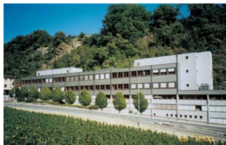
Ecole d'ingénieurs du Valais, bâtiment F à Sion