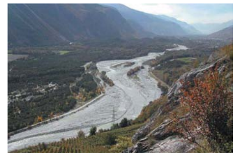
R3 plan d'aménagement du Rhône