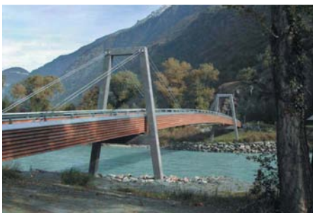
Passerelle haubanée en bois sur le Rhône Dorénaz